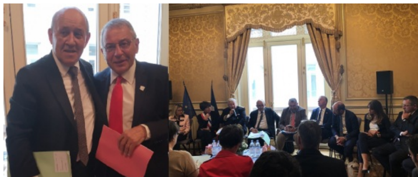
Table-ronde sur le tourisme durable avec Jean-Yves LE DRIAN